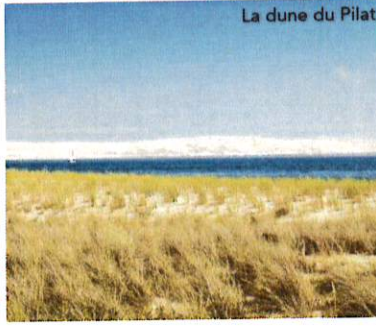
La dune du Pilat